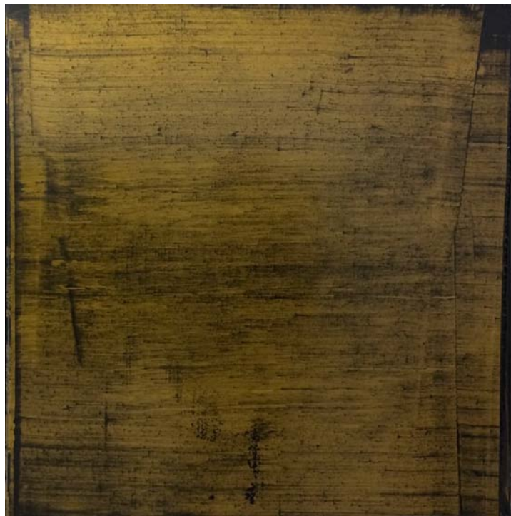
Bajo el párpado, II. Serie. 2015. Mixta sobre panel. 77 x 76 cm