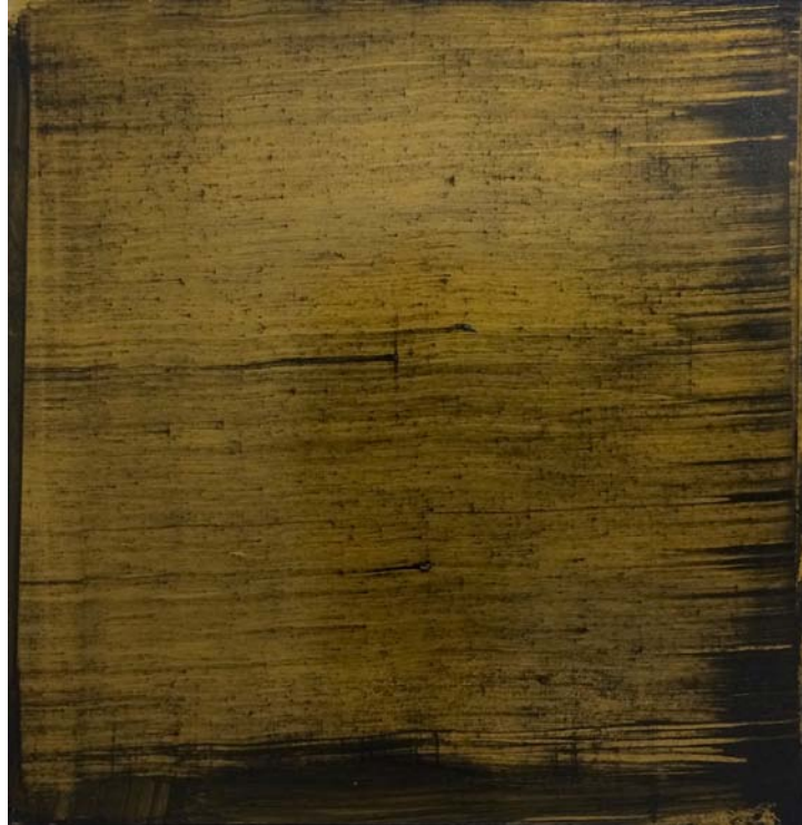
Bajo el párpado, I. Serie. 2015. Mixta sobre panel. 77 x 76 cm