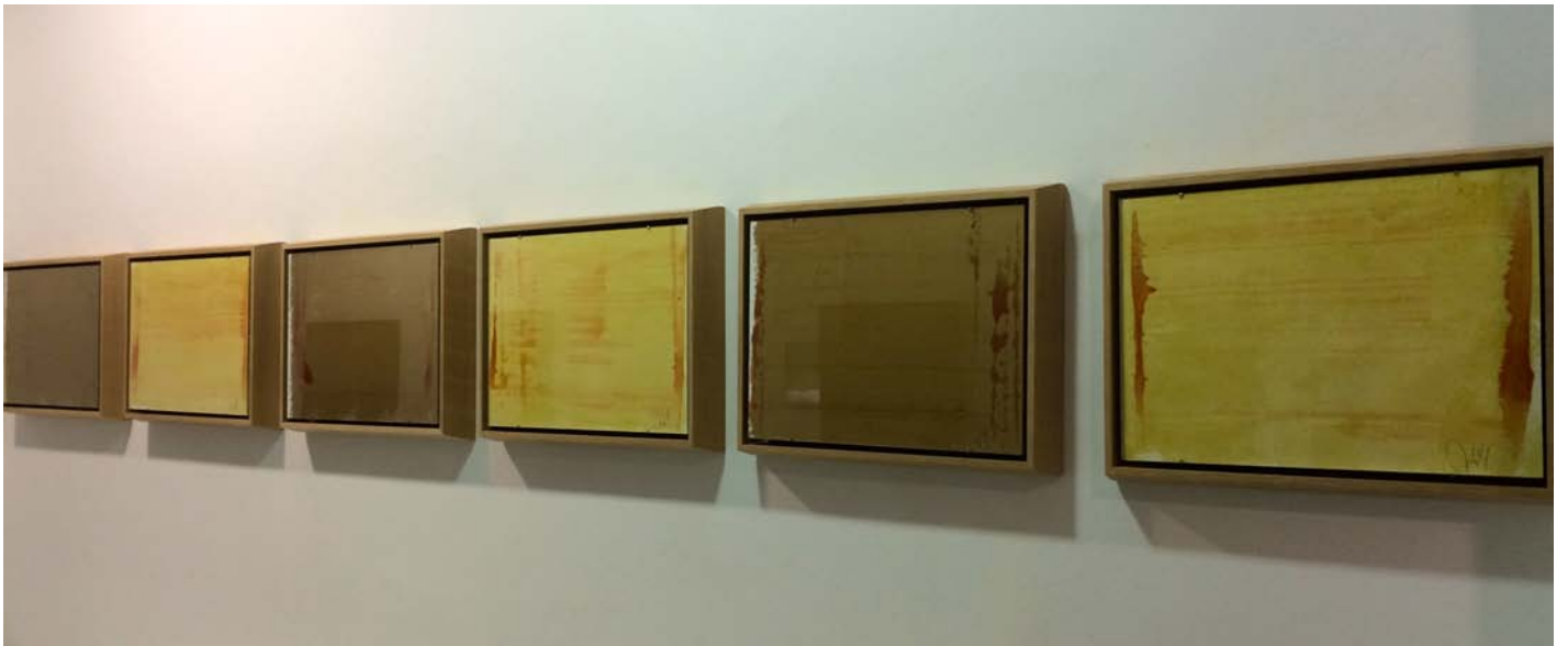
Forma (El residuo que sólo nos deja lo que ha sido llama). Serie. 2014. Mixta sobre papel. 36 x 48 cm