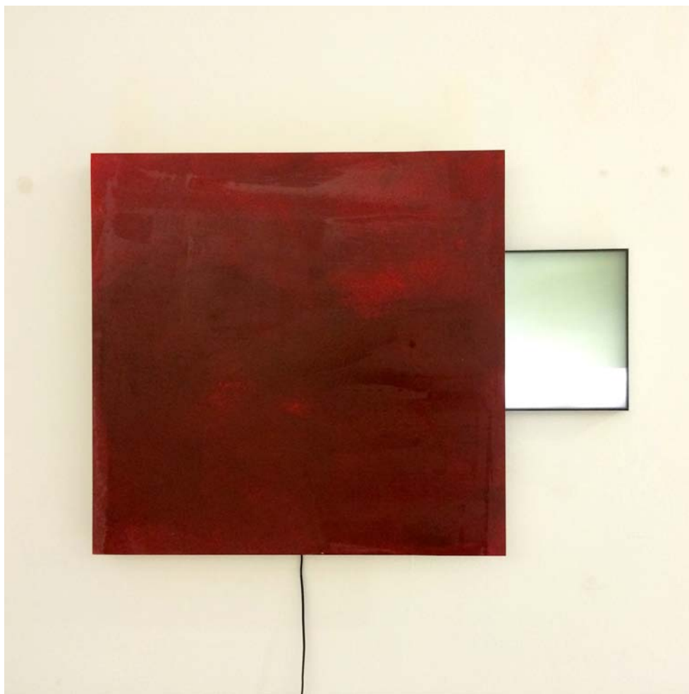
Torcello . Serie. 2014. Medidas variables. Mixta sobre panel y retroluminación