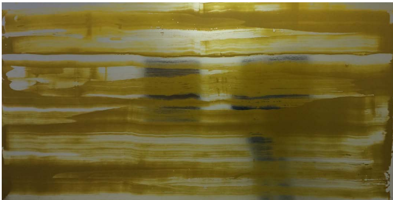
Respiración sin fin del fondo. Serie. 2015. Mixta sobre soporte vinílico. 112 x 215 cm